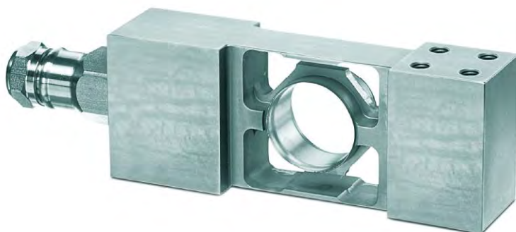
Рисунок 3 – Внешний вид датчика МР 55.