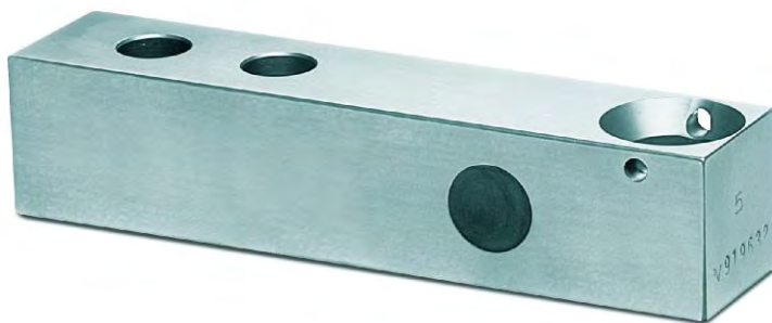
Рисунок 4 – Внешний вид датчиков MR 58 и MR 58Т.