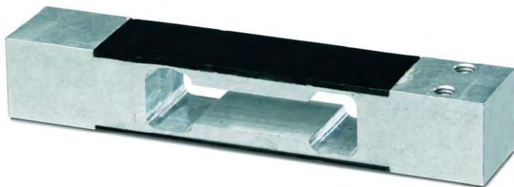
Рисунок 1 – Внешний вид датчика МР 70.

Внешний вид датчиков показан на рисунках 1-6.