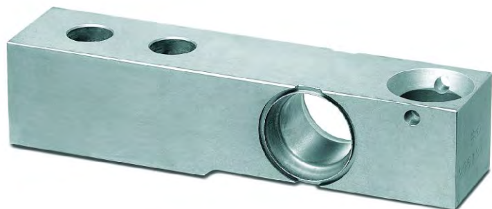
Рисунок 6 – Внешний вид датчиков MR 79 и MR 79Т.

Принцип действия датчиков основан на изменении электрического сопротивления тензорезисторов, соединенных в мостовую схему, при их деформации, возникающей в местах наклейки тензорезисторов к упругому элементу датчика, под действием прилагаемой нагрузки. Изменение электрического сопротивления вызывает разбаланс мостовой схемы и появление в диагонали моста электрического сигнала, изменяющегося пропорционально нагрузке.