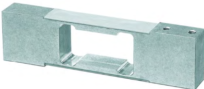
Рисунок 2 – Внешний вид датчика МР 71.